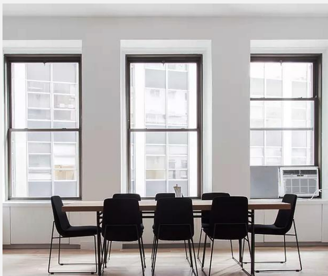
Foto. Las instalaciones del Club Internacional de Empresarios & Emprendedores

La nueva web incorpora información sobre nuestra organización, proyectos, los servicios que ofrece, las noticias actuales y la información diaria que nos ofrece CIEE RADIO.