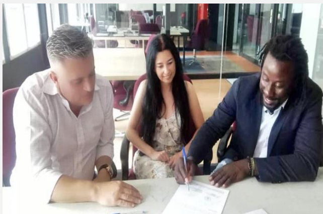
Foto: Firma del acuerdo